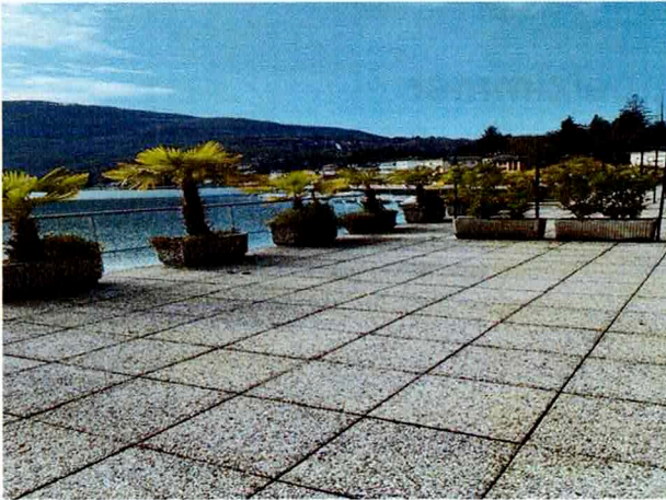
Hotel am Luganersee